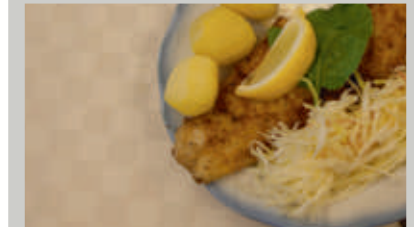
Middag med Hjälmarö