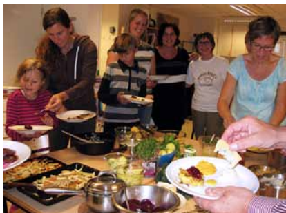
Klimatpiloterna tar för sig av den vegetariska, klimatsmarta buffén.

Klimatpiloterna i Mora och Orsa har i sina inledande uppdrag bl.a. provat på klimatsmart matlagning, att hitta sina eltjuvar och genomföra ett köpstopp. Nu väntar nya uppdrag som inventering av kyl, frys och skafferi, källsortering av resor och klimatsmarta fritidsaktiviteter.