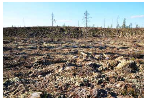
Ångermyran före (t.v.) respektive efter avverkning (t.h.)

Området Ångermyran, strax norr om Idre besöktes 2008. Sveaskog fick då vetskap om de naturvärden som Naturskyddsföreningen påträffade där. Flera fynd av rödlistade arter dokumenterades. Bland annat kan nämnas de starkt hotade arterna urskogsporing, taigataggsvamp samt smalfotad taggsvamp. Ångermyran är en sandbarrskog som är en av våra mest hotade skogsmiljöer och bedöms därför som ytterst skyddsvärd. Trots alla uppgifter bolaget fått om området Ångermyran, på ca 30 ha, har de avverkat och markerett det.