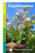
Fröpåse ängsfröer – pris till deltagarna

Superenkel tipspromenadsaktivitet. Ett bra sätt att väcka tankar om naturen, som kan leda till vidare diskussioner. Lycka till!