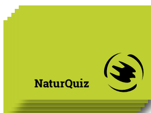
NaturQuiz på tjockt A4-papper