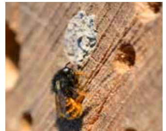
Rödmurarbi vid sitt bo.

Ja, oftast fungerar det, testa själv! Du ser om det är bebott genom att rören är igenmurade med blad, kåda eller lera.