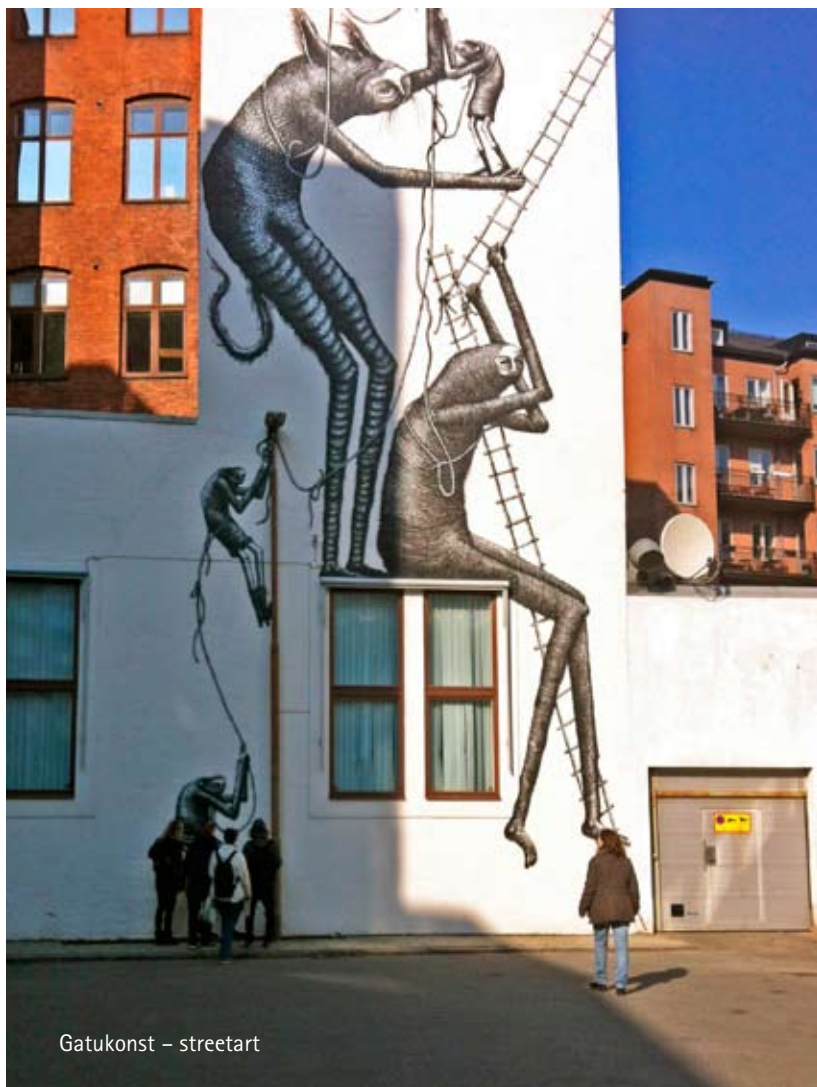
Gatukonst – streetart

Vad är gatukonst och hållbar stadsutveckling? Kan elever använda den konstnärliga processen för att ta plats i det offentliga rummet och stärka sin känsla av delaktighet i stadens utveckling? I projektet gör elever avtryck i Malmös stadsbild. Först kartlägger vi Malmös gatukonst och offentliga konst genom en konstvandring och fältstudie i olika stadsdelar. Sedan skapar eleverna sina egna gatukonstverk.