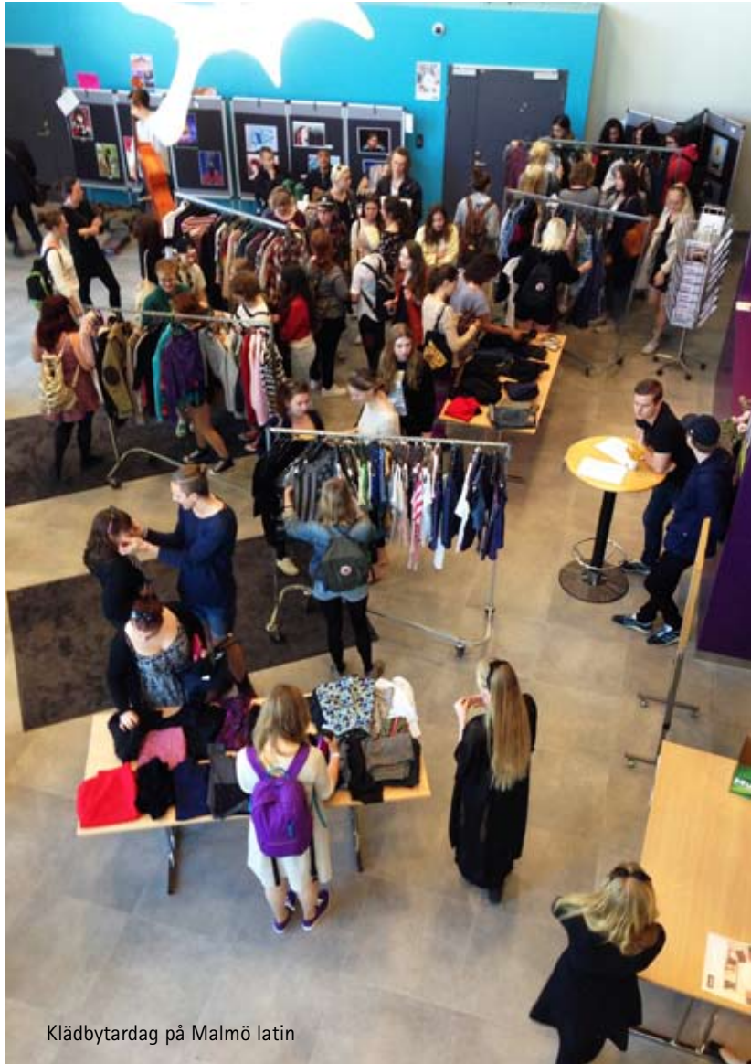
Klädbytdag på Malmö latin