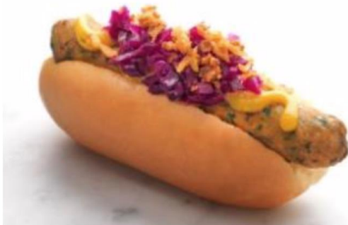
Vegetarisk korv, bröd och tillbehör: 68g CO 2 /korv

En lunch bör vara max 0,5 kg CO 2 . (Källa: WWF)