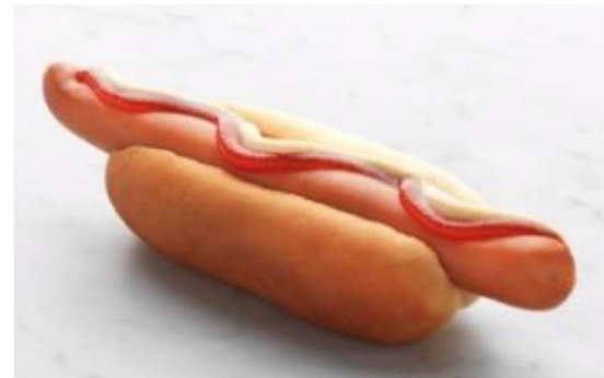
Korv med bröd och tillbehör: 538g CO 2 /korv