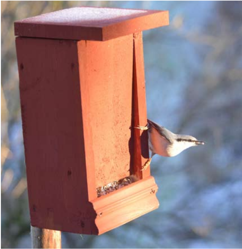
Nötväcckan besöker gärna fröautomaten.