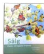
Sälgboken (lottas ut som pris)