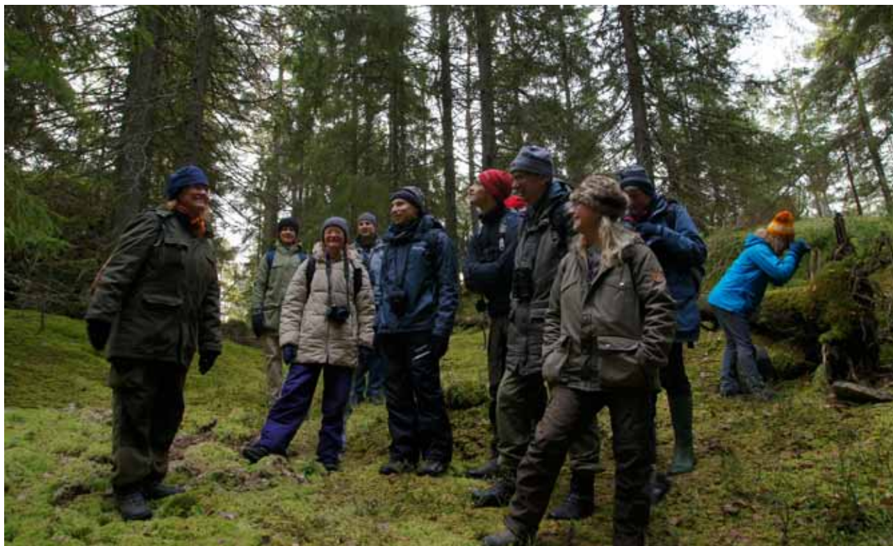
Skogsupplevelser är svåra att värdera i pengar. Forskning visar dock att det finns stora hälsovinster av att vistas i skogen. Skogen är viktig för människans välbefinnande och det är inte självklart att andra sätt att använda skogen alltid ska behöva stå tillbaka för virkesproduktion.

bara råvaror som grund. Det innebär att skogen i ännu högre grad också ska räcka till uppvärmning och fordonsbränsle, byggnadsmaterial, tyg, papper och mycket annat.