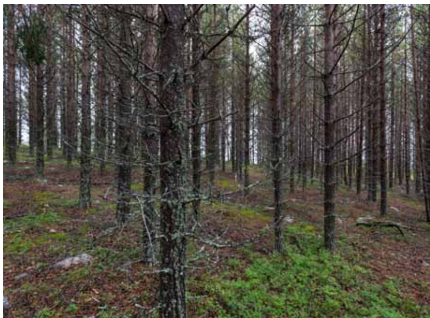
Kalhyggen är den skogsbruksmetod som är helt dominerande i dag. Den uppväxande skogen sköts sedan med röjning och gallring för att öka produktionen. Detta har inneburit att stora delar av skogsarealen har omvandlats till monotona skogar, som på bilden, utan naturskogens variation och artrikedom. Det behöver bli enklare att använda sig av, och planera för, andra metoder än kalhyggen så att skogen kan producera inte bara virke utan även andra ekosystemtjänster.