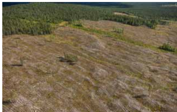
Naturhänsyn på ett kalhygge som markberetts och återplanterats med träd av samma art och ålder. De små trädgrupper som lämnats på hygget kan aldrig ersätta mångfalden som fanns i den naturskog som avverkats. Varje naturskogsavverkning innebär minskad variation och artrikedom i skogslandskapet.

När skogen brukas som idag, ofta med stora hyggen och bristande hänsyn till naturvård och människors behov av upplevelser, förändras sakta hela skogslandskapet. En naturskog innehåller gamla träd, grova träd, träd av olika