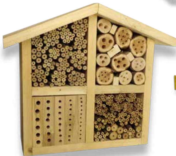
Vildbi-lyxhotell av träbitar, bambu och ihåliga växter – fläder, hallon, vass.