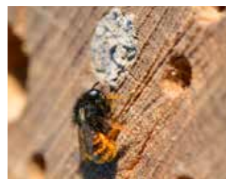
Rödmurarbi vid sitt bo.

Rapportera ditt vildbihotell på www.bivanlig.nu