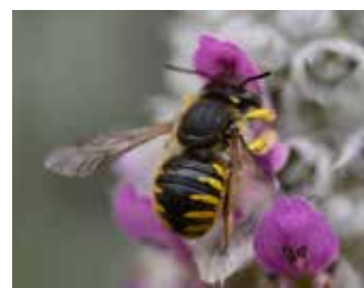
Storullbi på lammöra.