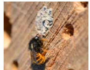
Rödmurarbi vid sitt bo.

Rapportera ditt vildbihotell på www.raddabina.nu