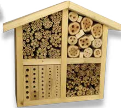
Vildbi-lyxhotell av träbitar och ihåliga växter, fläder, hallon, vass.