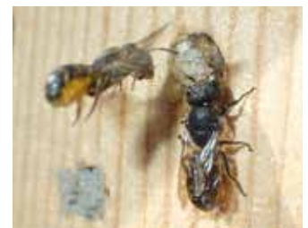
Väggbin vid bohål.